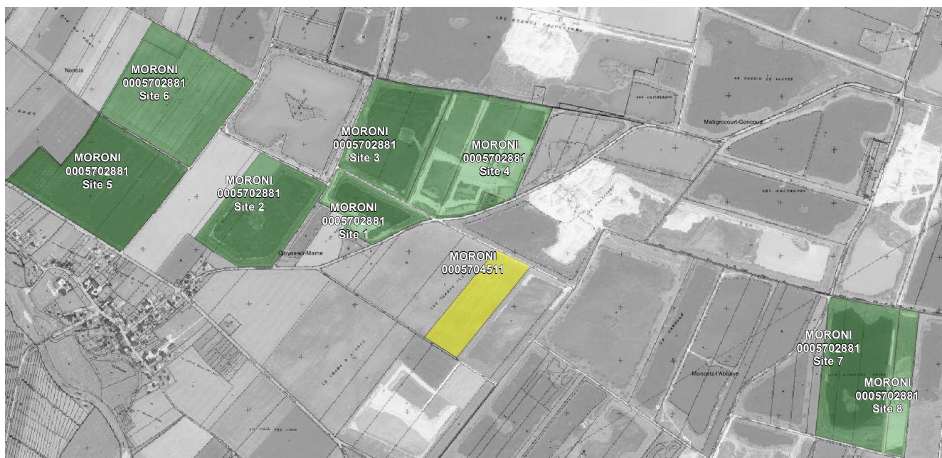
Figure 2: Situation projetée après modification