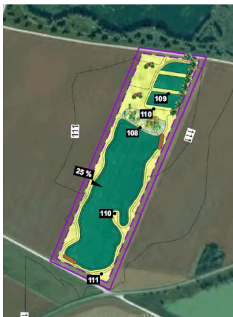
AIOT 00005704511 - Etat final du site 1 prescrit par l'arrêté préfectoral 2015-A-015-CARR du 15 septembre 2015 sur les parcelles Z 64 et Z65

Les états finaux des sites respectifs étaient les suivants :