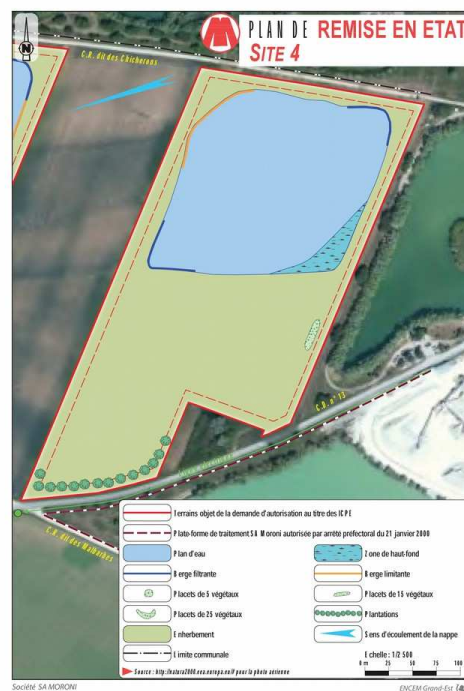
AIOT 0005702881 - Etat final du site 4 prescrit par l'arrêté préfectoral complémentaire du 26 octobre 2020

◦ Carrière 0005704511 : L'état final du site 2 de cette carrière est inchangé.