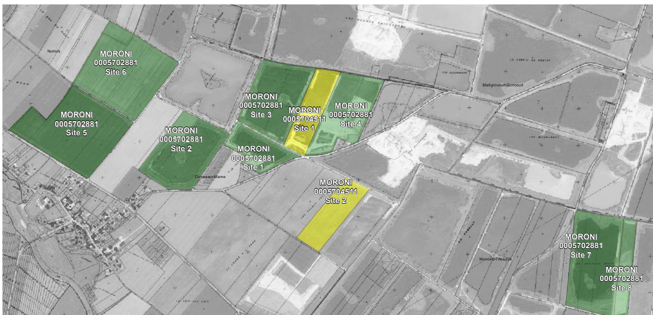
Figure 1: Situation actuelle

Le site 1 de la carrière 0005704511 étant contigu à l'Ouest au site 4 de la carrière 0005702881, l'exploitant a demandé à intégrer ce site 1 au site 4 afin de proposer un réaménagement cohérent du nouveau site 4.